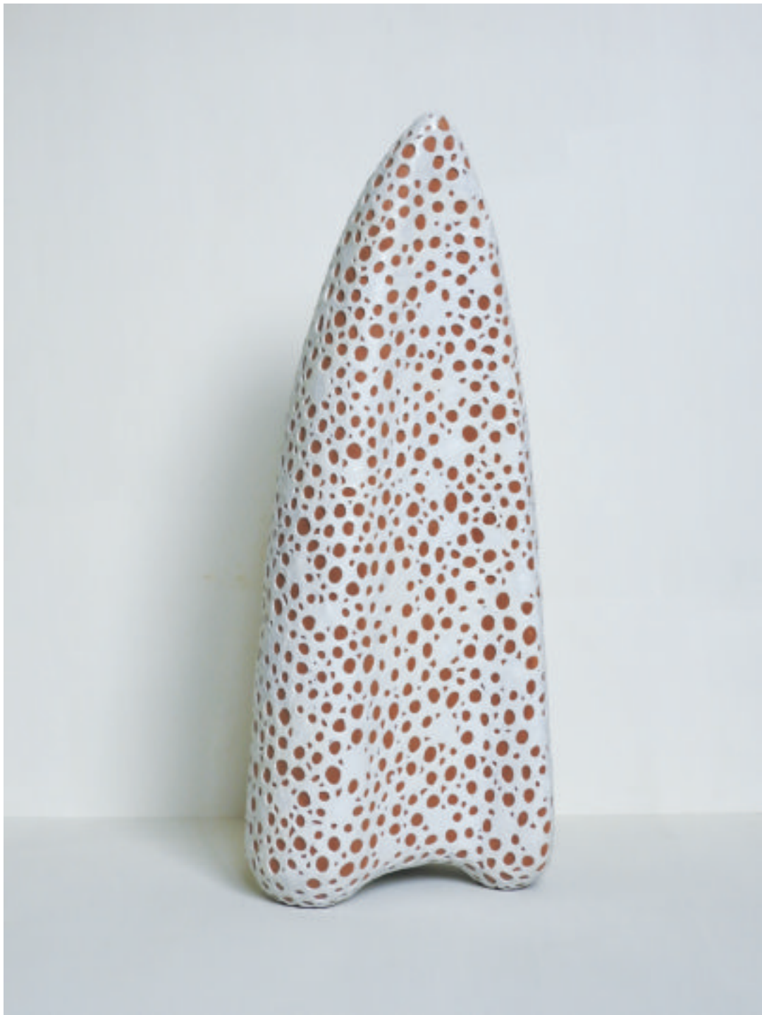
松隈康夫 風待ち／木，熱溶融接着剤 H 630×W 250×D 230 mm 2017 年