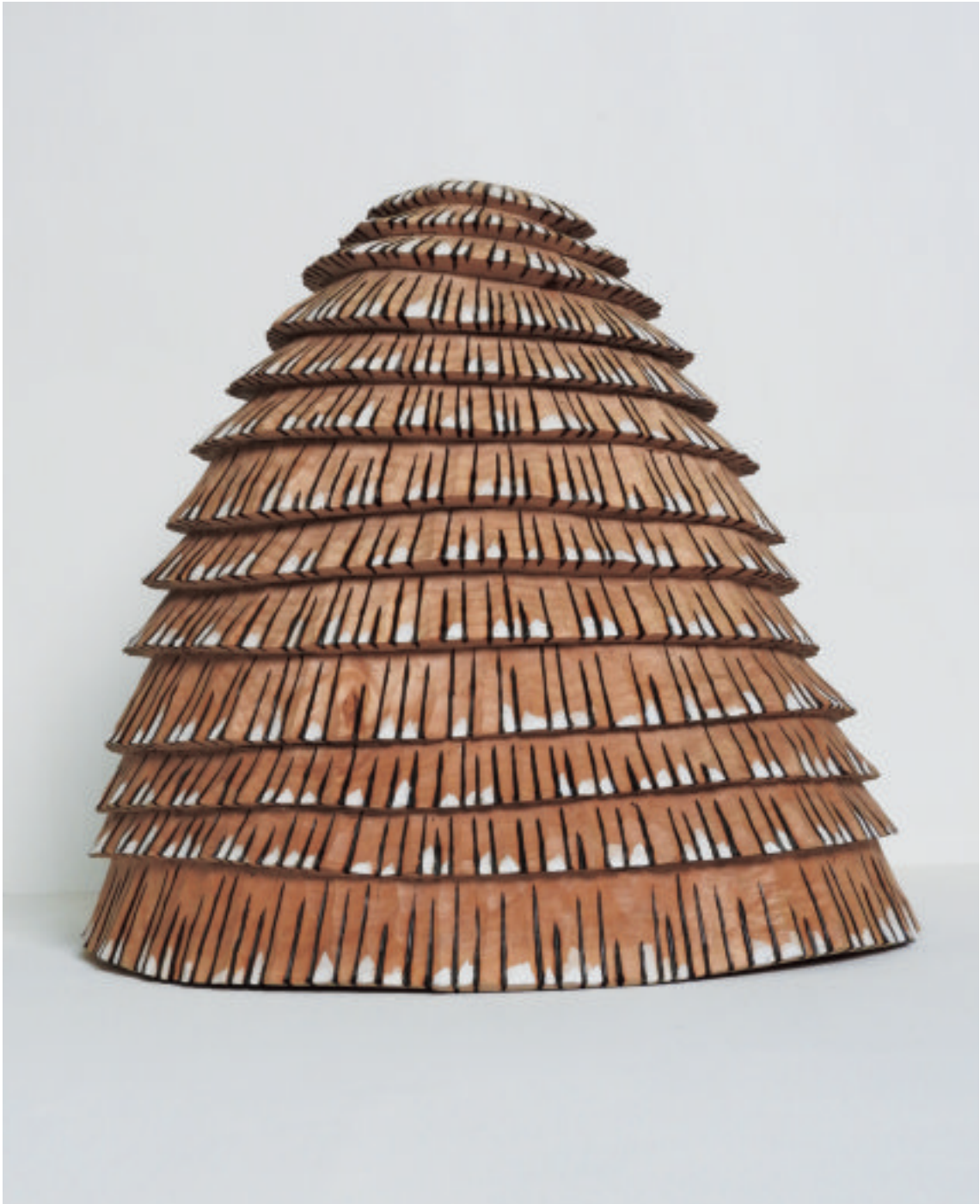
松隈康夫 風待ち／木, アクリル H 380×W 380×D 280 mm 2017 年