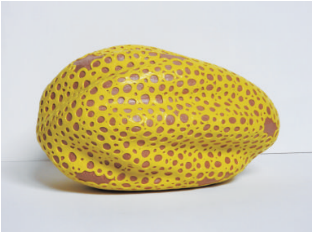
松隈康夫 風待ち／木, 熱溶融接着剤 H 220×W 350×D 270 mm 2017 年