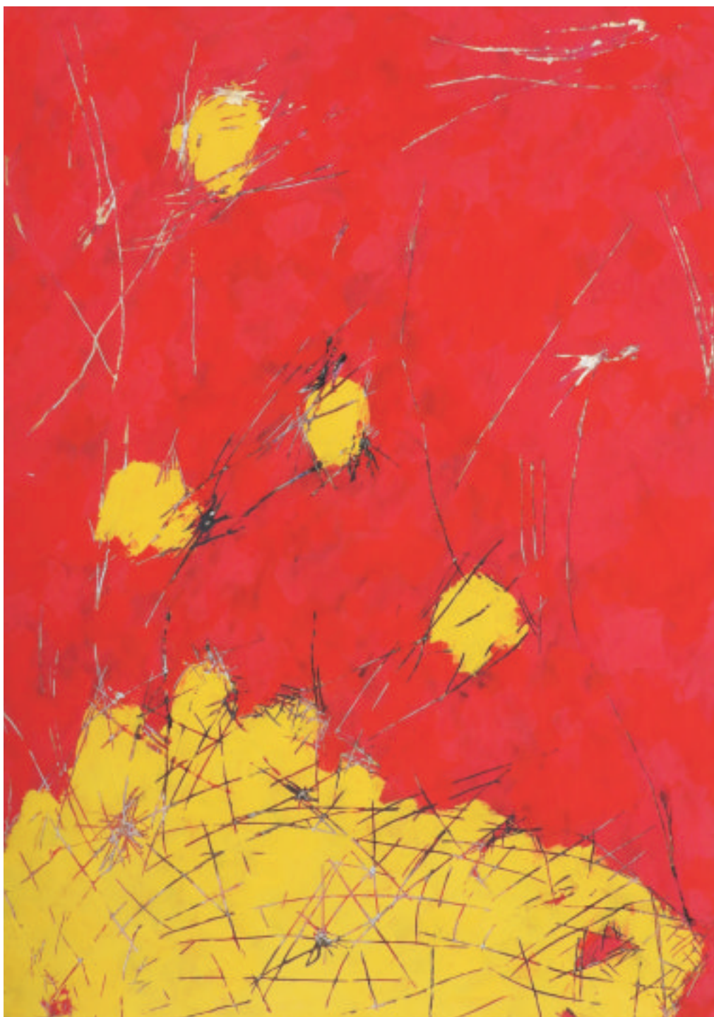
松隈康夫 浮遊/アクリル, 金箔 H 1030×W 730 mm 2017年