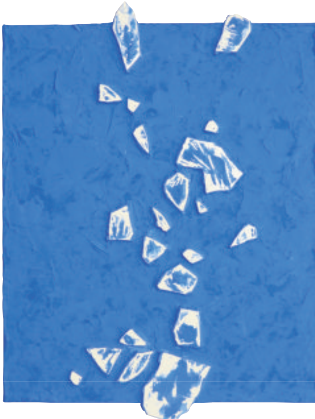
松隈康夫 浮遊/アクリル, タイル H 510×W 380 mm 2017 年