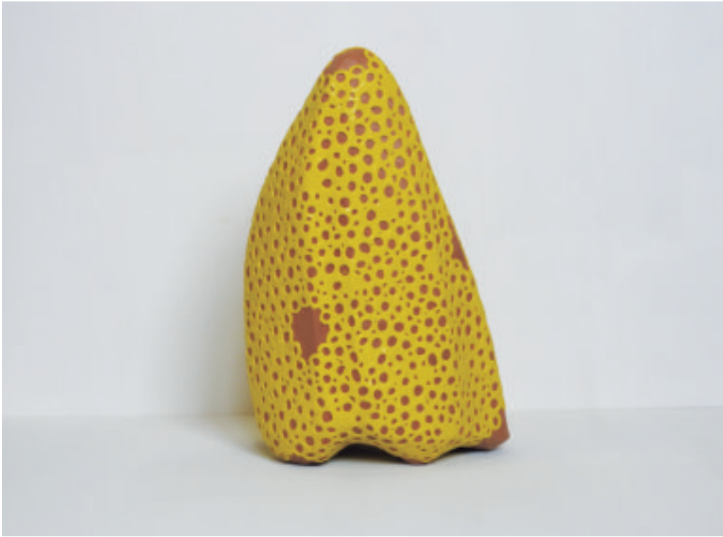
松隈康夫 風待ち／木, 熱溶融接着剤 H 430×W 270×D 210 mm 2017 年